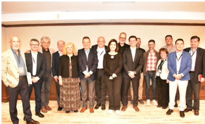
Foto: Reunión GIE

Como Cámara Ecuatoriana del Libro, estamos comprometidos en seguir trabajando para ustedes en eventos de gran relevancia internacional como la FIL Guadalajara y desde ya anunciamos nuestra participación el próximo año con un stand de más alcance, excelente ubicación y más amplio, para incluir a más expositores que representen a nuestro país.